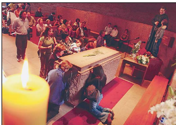
La imagen, captada en la tarde de ayer, muestra la gran afluencia de visitantes a la tumba del padre Hurtado, ubicada en General Velásquez. En ese lugar comenzará hoy la gran vigilia.

dirigió todos sus esfuerzos. "Ellos se sienten muy comprometidos con la vigilia", dijo un voluntario de Un Techo para Chile.